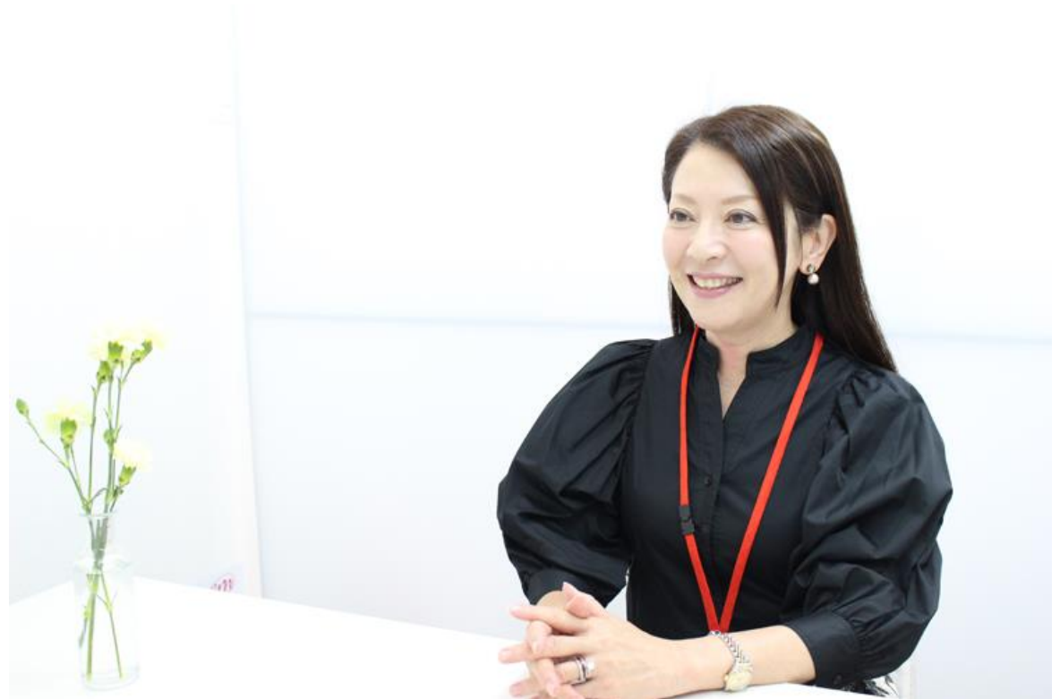
結婚カウンセラー

「良い方が入れば結婚はしたいけれど、出逢う場所がなくて・・・」なんて言葉をよく耳にします。そんな時私はいつも「どうして結婚相談所に行かないのかしら？」と不思議に思います。沢山の会員様の中から、きっとあなたと相性が合う方がいらっしゃるのでは？ 始めは不安なお気持ちでいらっしゃるお客様が、ご成婚となられて退会されます時には、本当にお幸せそうなお顔。その笑顔を見るのが、何より嬉しい事です。結婚って本当に良いものですよ！あなたのご結婚の第一歩を、ぜひお手伝いさせていただきます。