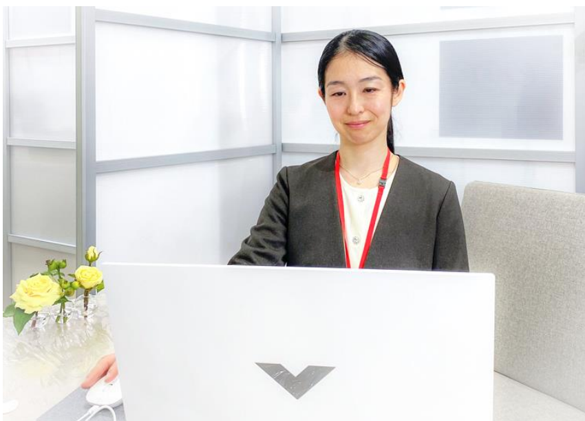
結婚カウンセラー 代表